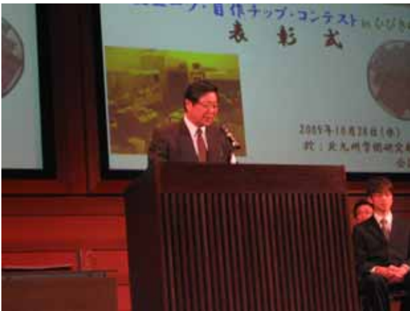
國武 理事長 挨拶