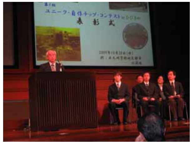
山川審査委員長 総評