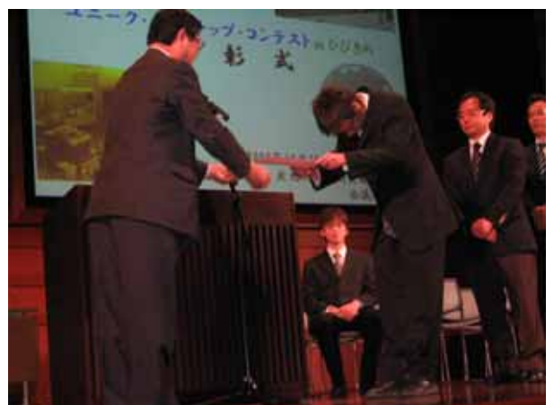
國武理事長より、優秀賞 賞状授与