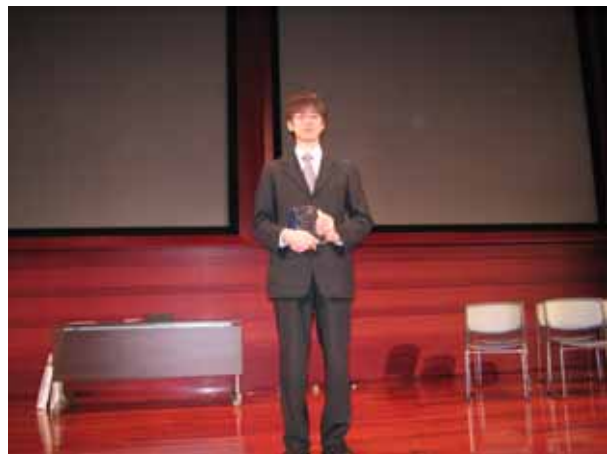
最優秀賞 受賞 東芝情報システム株式会社 グループ