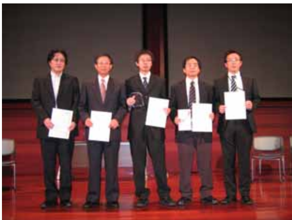
優秀賞 受賞 東海大学 グループ