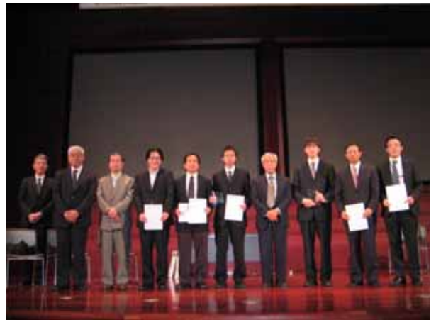
審査委員長を囲んで記念写真