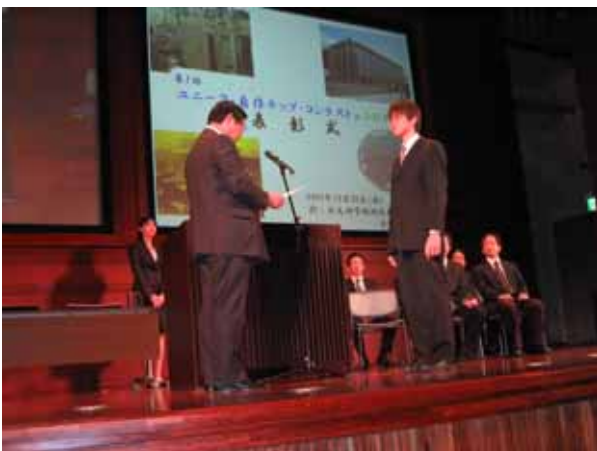
國武理事長より、最優秀賞 賞状授与