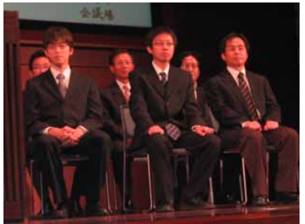
受賞者のみなさん